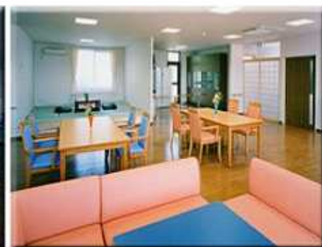
グループホームリビング