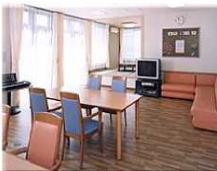
グループホームリビング