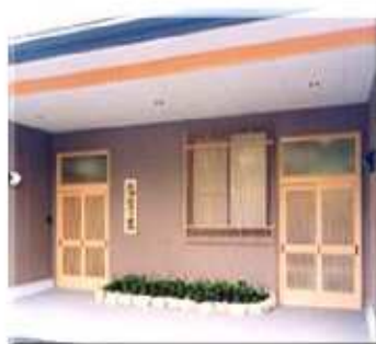
グループホーム玄関