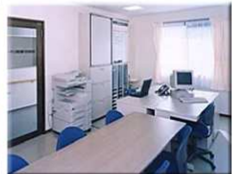
在宅介護支援センター