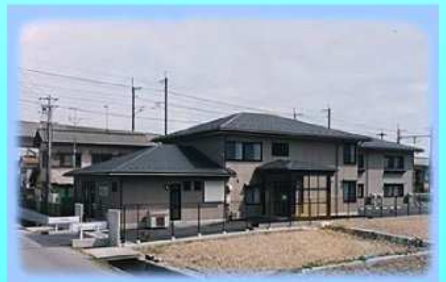
滋賀県大津市南志賀三丁目1番18号