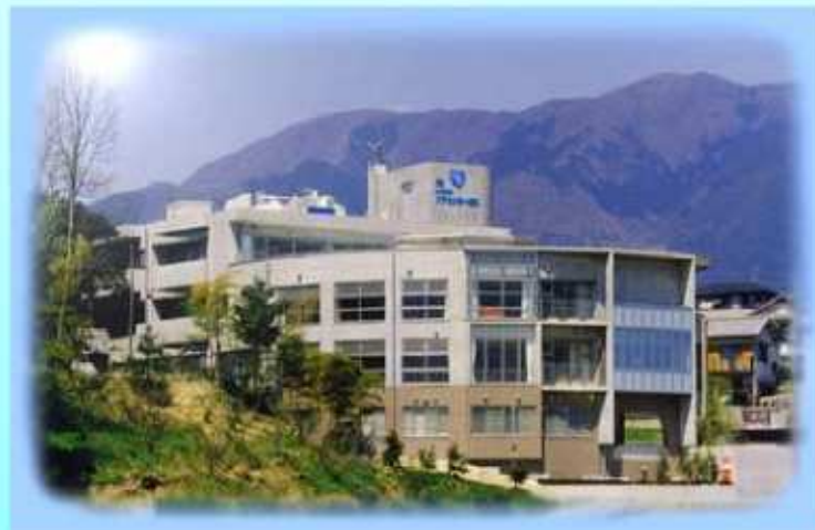
滋賀県大津市和邇高城260番1