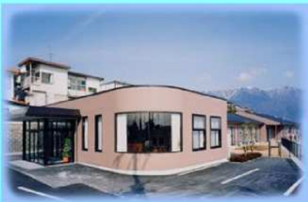
滋賀県大津市和邇高城270番2